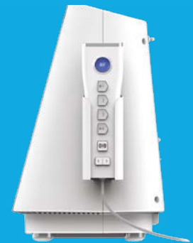
Controle remoto para o gerador de RF Symplicity G3