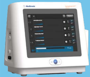
Gerador de RF para denervação renal Symplicity G3™

DESEMPENHO COM PRECISÃO. ENTREGA COM CONSISTÊNCIA.